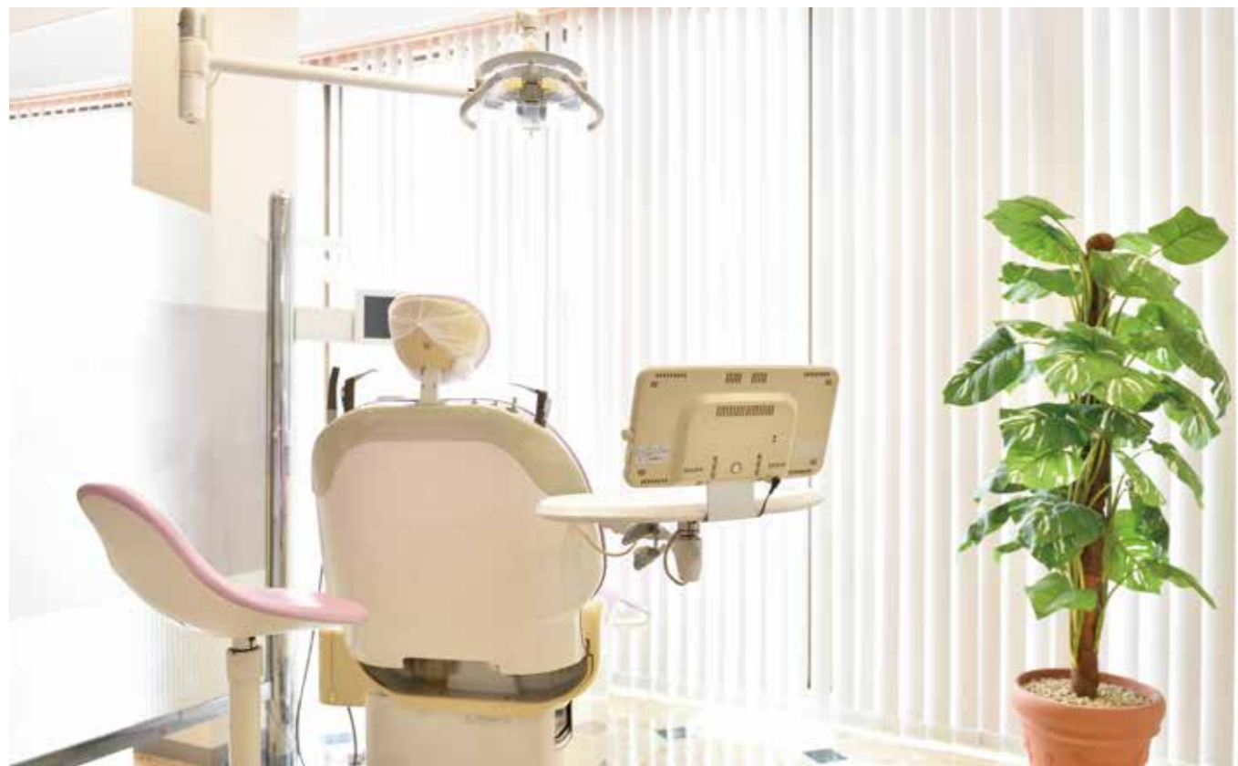
A～Dまで診察室は4部屋。うち1部屋は歯磨き指導やクリーニングなどメンテナンス専用。